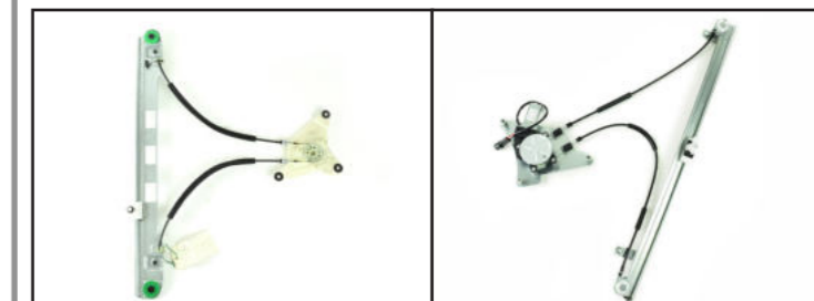
Alzacristallo originale - oem window regulator - lève-vitre original - Fensterheber von oem - elevalunas original - levantador de vidro original - orijinal cam acacagi - Γρύλος γνήσιος Nostro alzacristallo - our window regulator - notre lève-vitre - unser Fensterheber - nuestro elevalunas-nosso levantador de vidro - bizim cam acacagi - Γρύλος γνήσιος