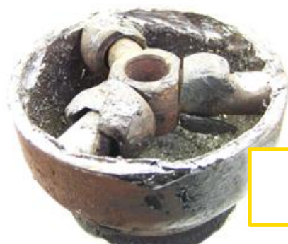
Bol et/ou tripode endommagés