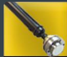
ARBRES DE TRANS