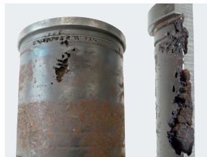
Иллюстрация 2: Кавитационное повреждение гильзы в районе верхней мертвой точки цилиндра