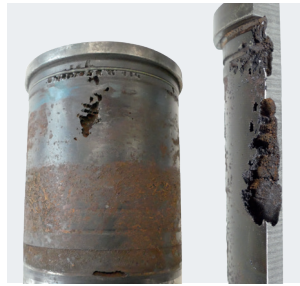
Resim 2: Üst ölü nokta bölgesinde kavitasyon hasarlı silindirik gömleği