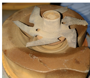
Figure 1 : Pale d'une pompe à liquide de refroidissement endommagée par cavitation