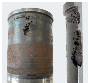
Figure 2: Cylinder liner with cavitation damage in the area around the top dead center