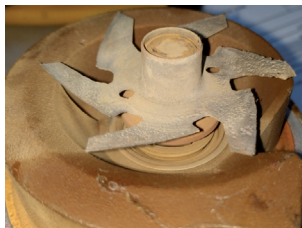
Иллюстрация 1: Кавитационная эрозия на пластине насоса охлаждающей жидкости