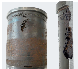
Figura 2: Camisa de cilindro con daños por cavitación en la zona del punto muerto superior