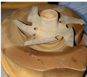
Figura 1: Aletas de una bomba de refrigerante desgastadas por la cavitación