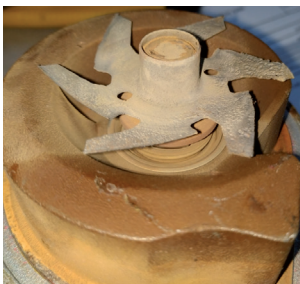
Figure 1: Coolant pump blade showing erosive wear caused by cavitation