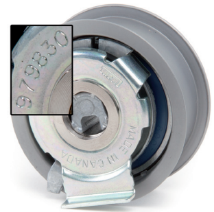
Photo 2: 531 0851 10 – Nouveau galet tendeur (979830)

En raison de nouvelles spécifications, le galet tendeur réf. 531 0851 10 remplace le galet tendeur réf. 531 0777 10.