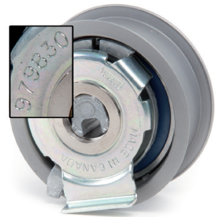
Fig. 2: 531 0851 10 – Polea tensora nueva (979830)

Debido a especificaciones modificadas, la polea tensora 531 0851 10 sustituye a la polea tensora 531 0777 10.