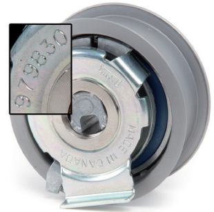
Bild 2: 531 0851 10 – Neue Spannrolle (979830)

Aufgrund geänderter Spezifikationen ersetzt die Spannrolle 531 0851 10 die Spannrolle 531 0777 10.