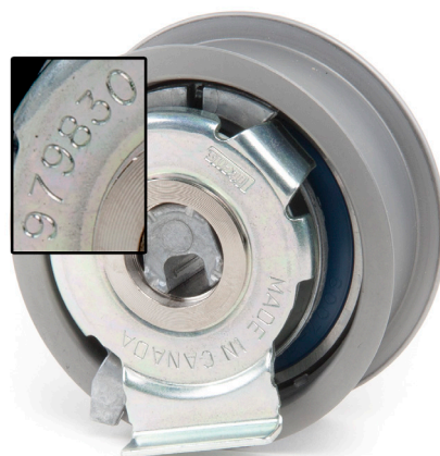
Obr. 2: 531 0851 10 – nová napínací kladka (979830)

Na základě změněných specifikací nahrazuje napínací kladka 531 0851 10 napínací kladku 531 0777 10.