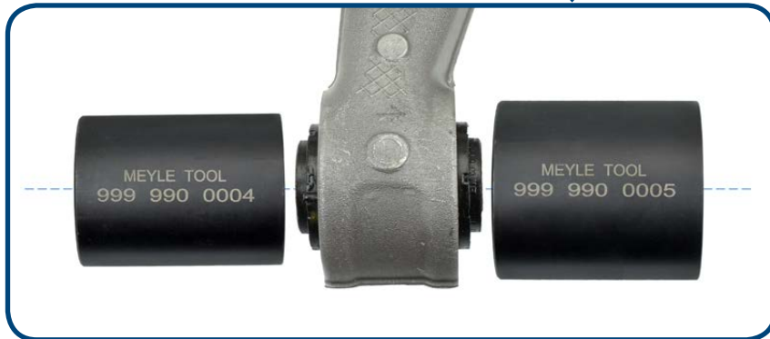
MEYLE no. 314 710 0032/HD Short no. MCB0514HD