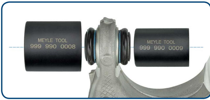
MEYLE no. 314 710 0031 Short no. MCM0185