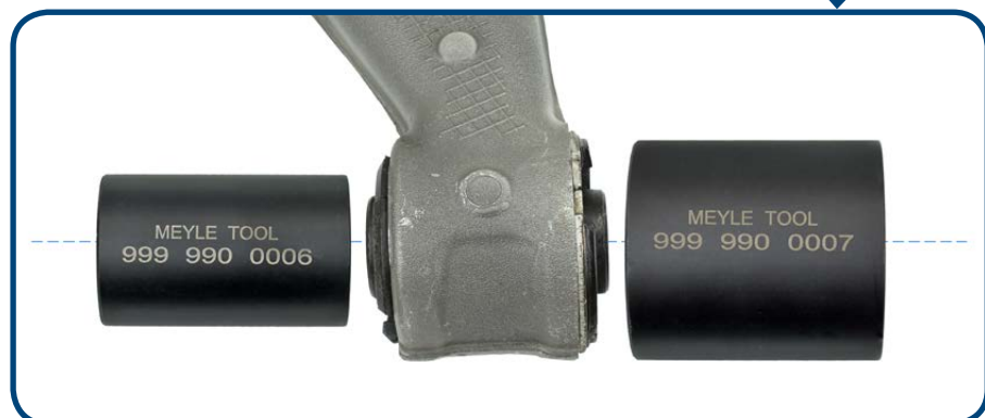
MEYLE no. 314 710 0033/HD Short no. MCB0532HD