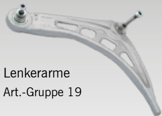
Lenkerarme Art.-Gruppe 19