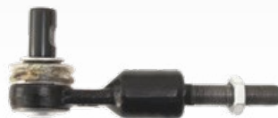
Spurstangenköpfe Art.-Gruppe 19