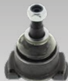
Traggelenke Art.-Gruppe 19