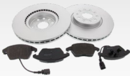
Carbon-Bremsensätze Art.-Gruppe 47