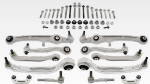
Reparatursätze Radaufhängung inkl. Montagesatz Art.-Gruppe 19