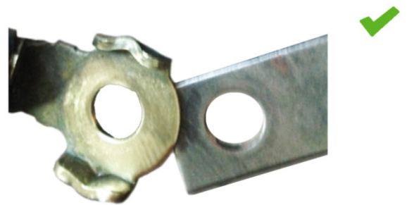
图示 2: 清洁后接地: 接触良好