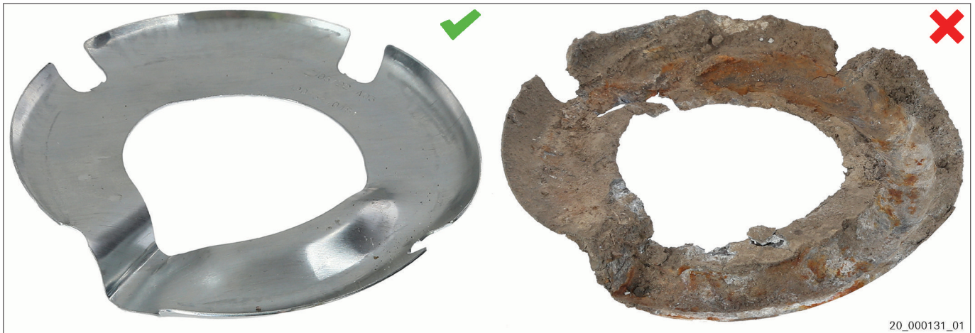
Fig. 3 Anod de sacrificiu nou | Anod de sacrificiu uzat

Anodul de sacrificiu este un electrod confecționat din metal comun (de exemplu, aluminiu). Protejează componentele realizate din metale prețioase (de exemplu, oțel) împotriva coroziunii de contact. Metalul de bază al anodului de sacrificiu este distrus în acest proces. Acest lucru asigură funcționarea pieselor metalice care sunt sensibile la coroziune și extinde durabilitatea pieselor.