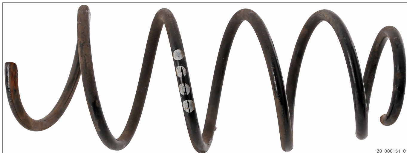
Fig. 2 Mola de suspensão usada com marcação em cores (exemplo)