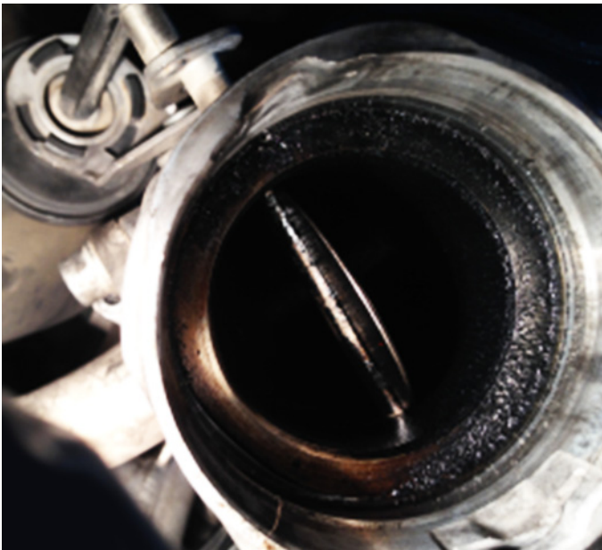
Fig. 4: la farfalla della valvola di ricircolo del gas di scarico è cokificata