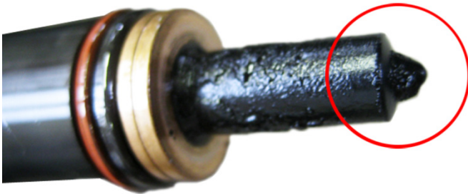
Fig. 3: ugello della pompa cokificato