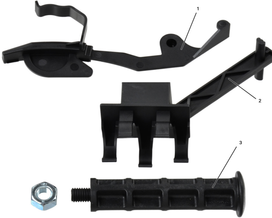
Abb./Fig 4: Montagewerkzeug / Assembly tool / Outil de montage / Herramienta de montaje