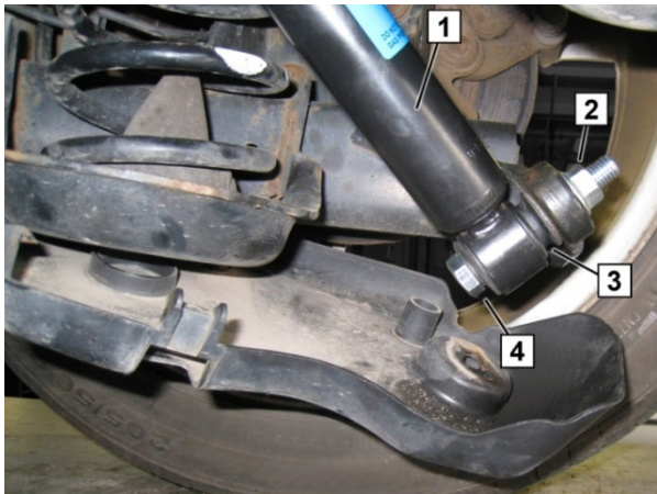
Abb./Fig. 2: Stoßdämpfer eingebaut / Shock Absorber installed / Amortisseur installé / Amortiguador montado