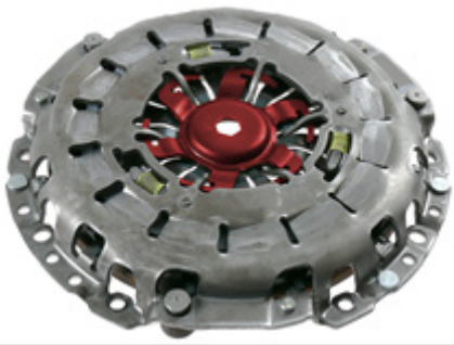
Abb. / Fig. 1: Selbstnachstellende Kupplung mit Verriegelungsstück Self-adjusting clutch with clutch locking piece Embrayage à rattrapage automatique avec pièce de verrouillage Embrague autorregulador con pieza de bloqueo enclavamiento Frizione autoregistrante con elemento di bloccaggio