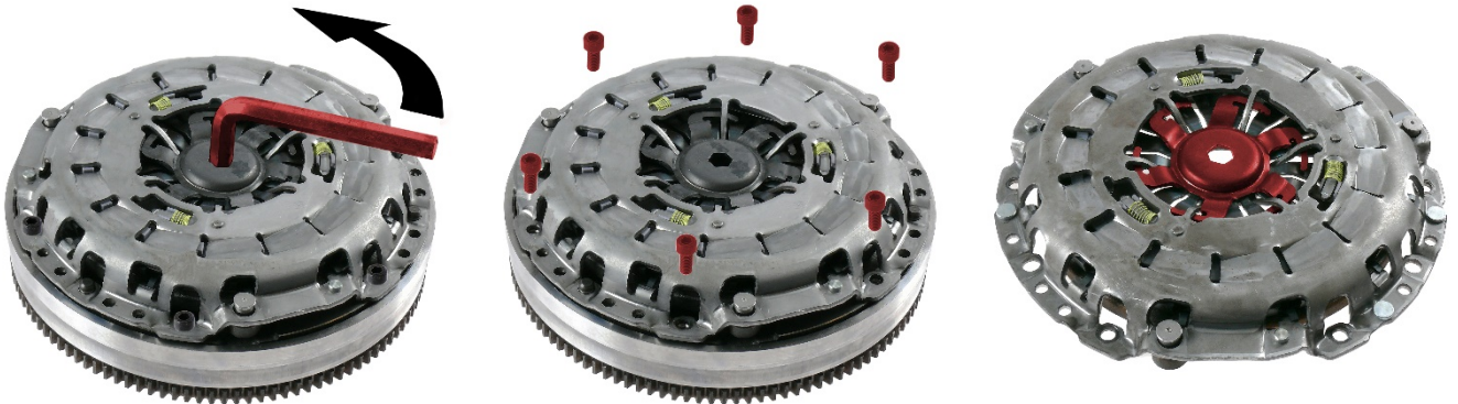
الشكل 3: فك قطعة تأمين القفل