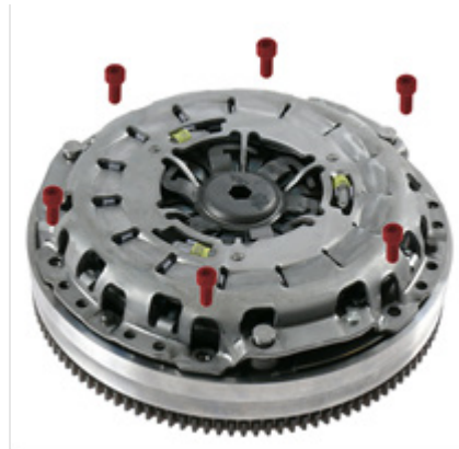
Abb. / Fig 2: Kupplung montieren Install clutch Monter l'embrayage Montar l'embrague Montaggio della frizione