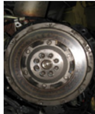
Βολάν 2 μαζών Transit Connect