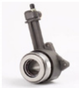
Υδραυλικό ρουλεμάν Transit Κωδικός Valeo 804508

Αντικαταστήστε το υδραυλικό ρουλεμάν , ακόμα κι αν η κατάστασή του φαίνεται καλή. Προλάβετε έτσι ενδεχόμενη αστοχία του μετά από λίγα χιλιόμετρα (διαρροή). Κωδικός υδραυλικού ρουλεμάν Valeo 804508 .