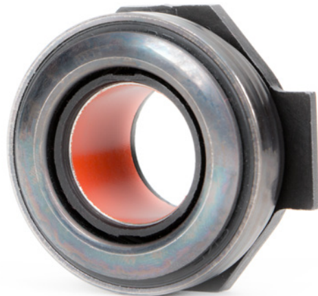
Fig. 3: Los cojinetes de desembrague con casquillo de PTFE no deben engrasarse con lubricante