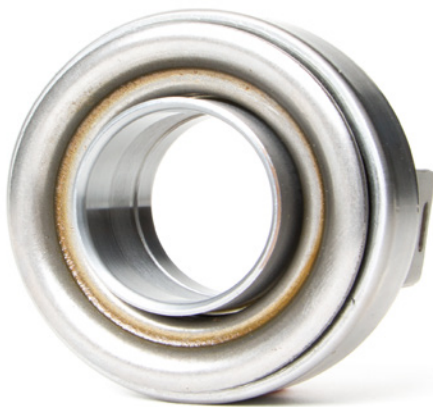
Fig. 1: Los cojinetes de desembrague con casquillo de metal deben engrasarse con lubricante

¡Observar las indicaciones del fabricante del vehículo!