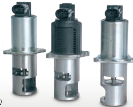
Vizualizare produs (extras)

Sub rezerva modificărilor textelor și ilustrațiilor. Pentru corespondența și înlocuirea pieselor consultați cataloagele valabile, CD-urile TecDoc și sistemele bazate pe datele TecDoc.