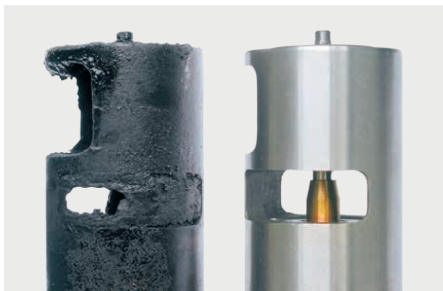
Soupapes EGR encrassée et à l'état neuf

Pour les remarques concernant le diagnostic et les causes possibles, cf. pages suivantes